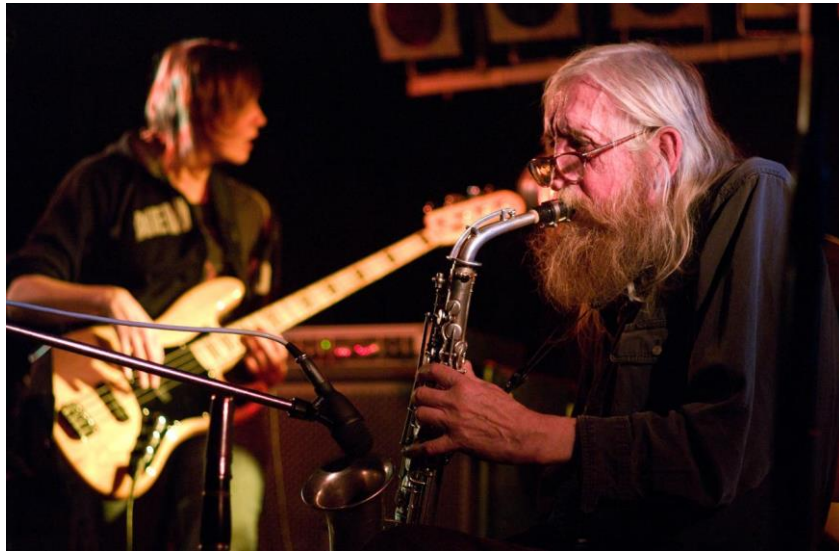
Úspěšný koncert undergroundové legendy Plastic People of The Universe