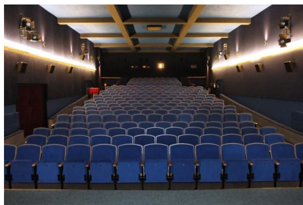
Nový interiér sálu kina Svatka

Letní kino Promítalo se zde od začátku července, po dva letní měsíce provozu proběhlo celkem 27 projekcí. Jednoznačně nejúspěšnějším filmem letní sezóny byl Doba ledová 4, kterou navštívilo rekordních 635 diváků a kino tak bylo vyprodáno. I přes fakt, že většina filmů se do letního kina v Tišnově dostala s několika měsíčním zpožděním, byla celková návštěvnost i díky přízni počasí vyšší než ve stálém kině v 1. polovině roku. Letní kino navštívilo během dvou měsíců 1483 diváků. 31. prosince zde také proběhl druhý ročník Silvestrovského promítání pro děti, který navštívilo celkem 120 dětí a jejich rodičů.