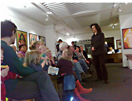
Úspěšná vernisáž výstavy malíře Vladimíra Kiseljova