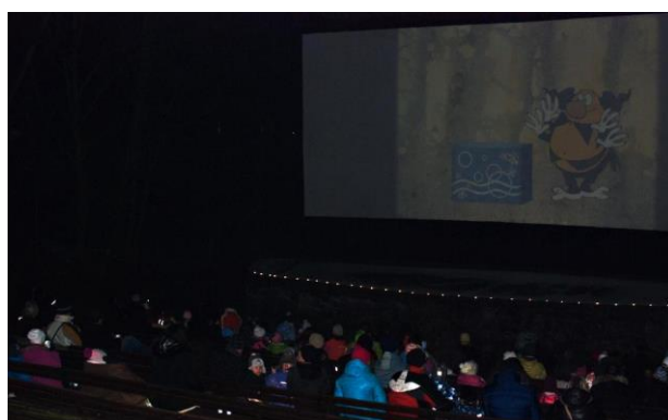
Silvestrovské promítání v letním kině